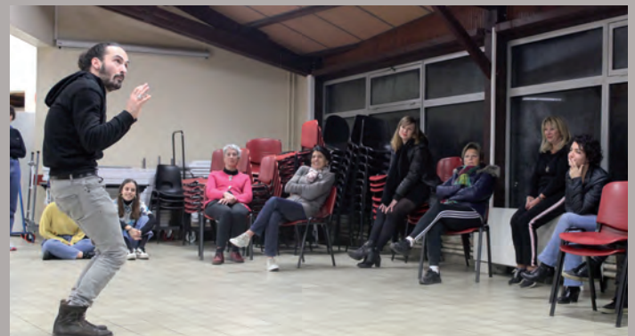
Stage théâtre encadré par la Cie L'Eternel été

Pour en savoir plus sur les actions culturelles, rendez-vous sur le site ou le Facebook de la Ville, ou en contactant le service culturel au 02 51 60 54 00 !