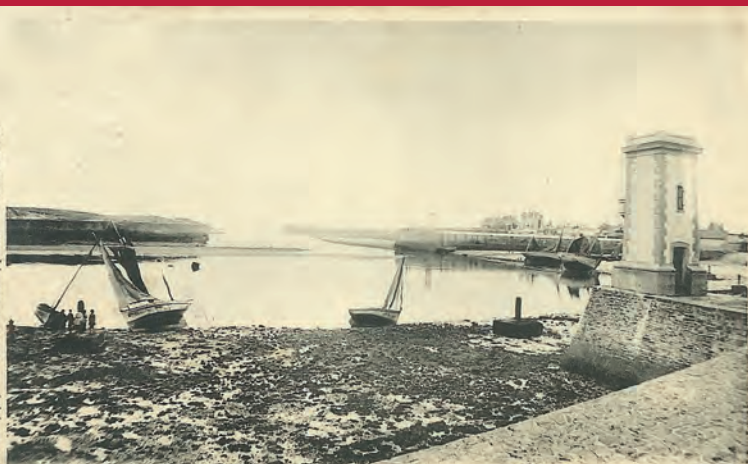
Souvenir affectueux. CROIX-DE-VIE — ENTRÉE DU PORT Nice Chi-Baudou