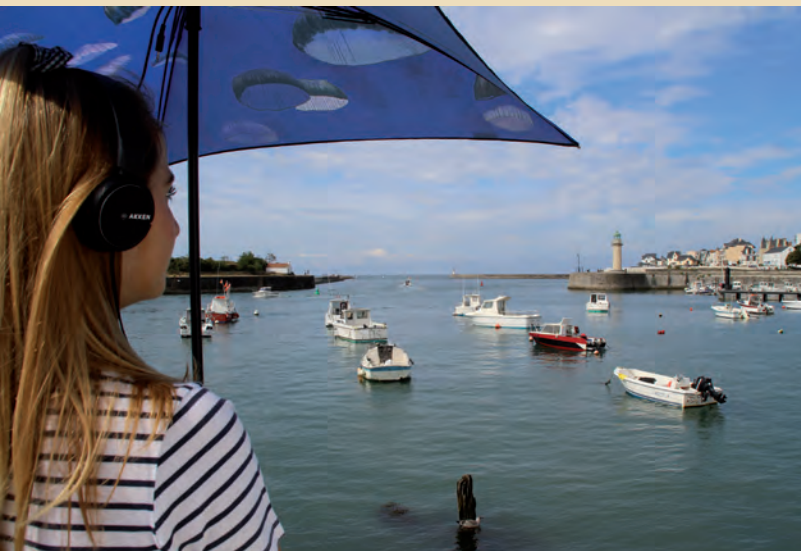
E. A. 5465 — Croix-de-Vie