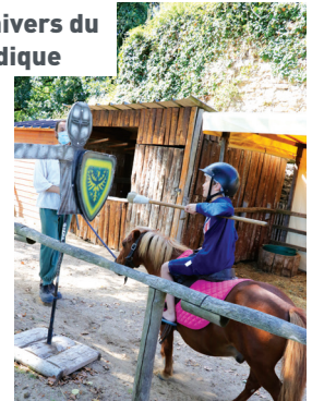
Parcours du p'tit chevalier