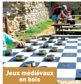
Jeux médiévaux en bois