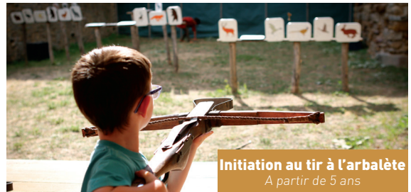
Initiation au tir à l'arbalète