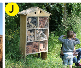
J Gîte à insectes