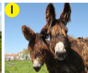
I Baudets du Poitou