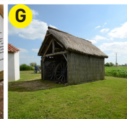
G Loge en roseau