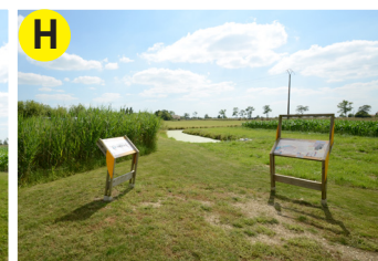
H Filtre à roseaux et pompe de drainage