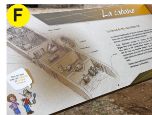
F Panneau sur la cabane