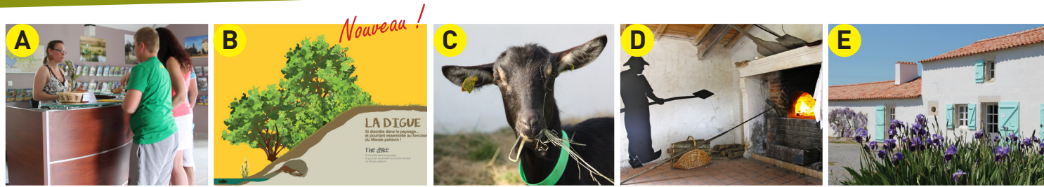
A Accueil du musée et Office de Tourisme