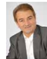
Jean-Michel LALÈRE Maire de Fontenay-le-Comte