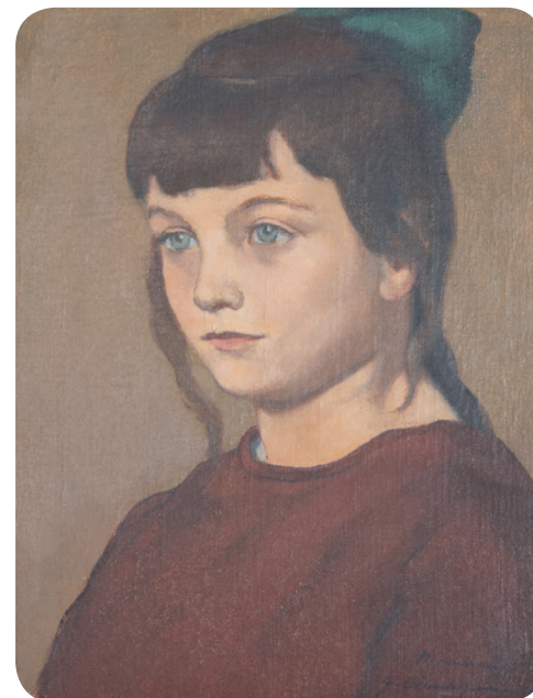
G.CHARLOPEAU, Portrait de Madeleine

Vernissage à 17h30 le vendredi 26 octobre