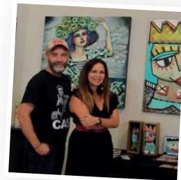
Séances de dédicaces avec les 2 artistes les 6, 7, 8 et 9 août et les mardi, mercredi et jeudi du mois d'août