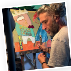
Live Painting avec Mika les 3, 4 et 5 août

Nous avons imaginé 3 délicieuses planches pour tous les goûts : la « millésimée » qui vous fera découvrir le cœur de notre savoir-faire, la « dégustation », permettant d'apprécier une sélection de nos meilleures recettes et la « Tapas à partager », pour les gourmands ou les plus nombreux.