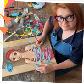
Exposition de Coralie Joulin jusqu'au 31 juillet