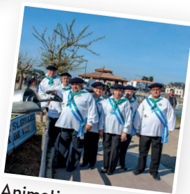
Animation « Levé de filets » par la Confrérie de la sardine les 6, 13 et 20 août