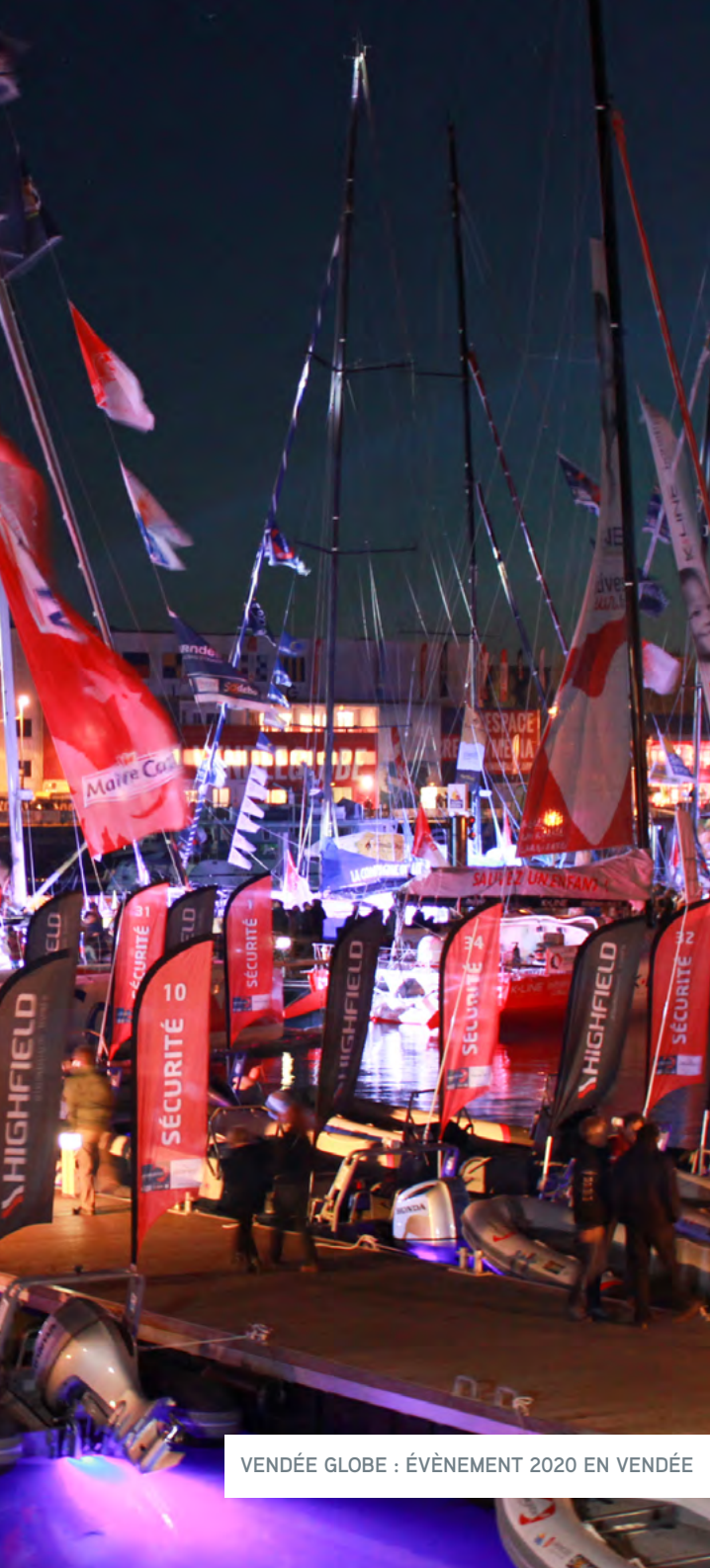
VENDÉE GLOBE : ÉVÈNEMENT 2020 EN VENDÉE