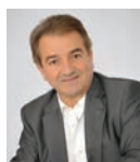
Jean-Michel LALÈRE, Maire de Fontenay-le-Comte