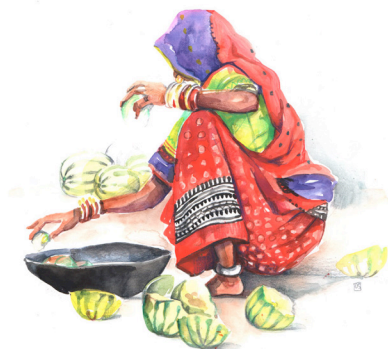
Artiste : Odile Santi