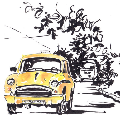
Artiste : Odile Santi

Vente d'objets rapportés des voyages au profit de l'association Sumati Balvan qui œuvre pour les écoles indiennes