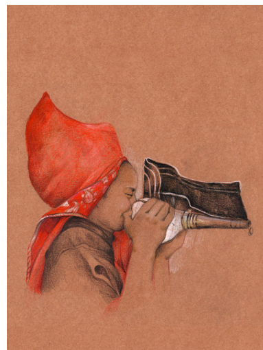
Artiste : Odile Santi