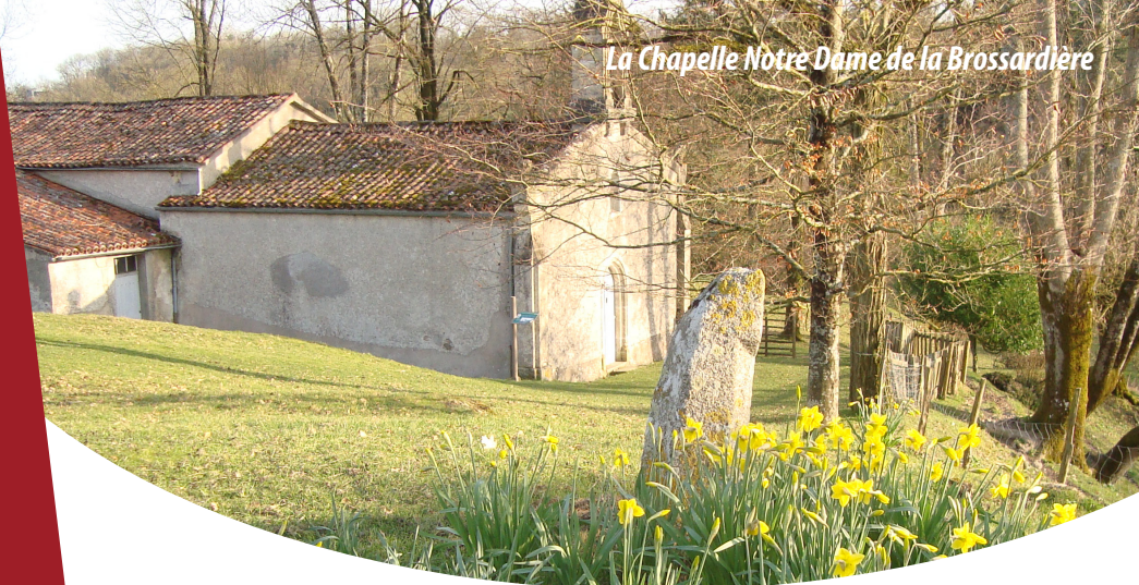
La Chapelle Notre Dame de la Brossardière