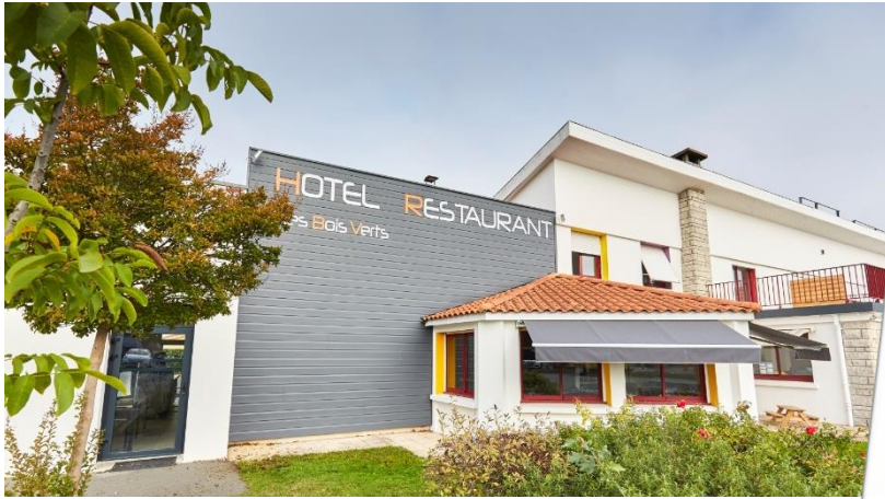
Hôtel rénové, situé aux Herbiers, au cœur de la Vendée