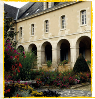
Jardin du Cloître de Mangers

VOIE VERTE MAINE SAOSNOIS UN TERRITOIRE À DÉCOUVRIR