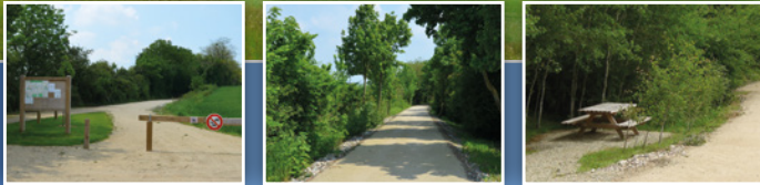
... des tables et des bancs pour faire une halte ...