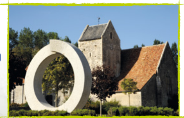
L'église de St Longis