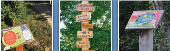
... un parcours botanique et un parcours poétique ...