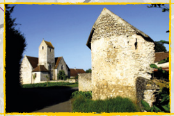
L'église de Ve Zot