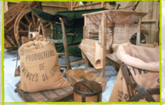
Maison du Chanvre et de la Ruralité à Saint Rémy du Val