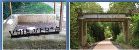
... des ouvrages d'art, témoins de l'ancienne voie ferrée ...