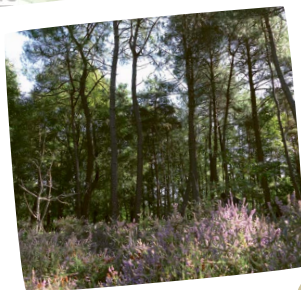
Lande du Maréchau

à gauche (chemin des Landes). 9 Prendre la 1 re à droite (chemin du Petit Surjaud). 10 Prendre à gauche sur le chemin du Vieux Renard. 11 Prendre à droite sur le chemin des Landes. 12 À l'embranchement, prendre à gauche. 13 Puis prendre à droite sur le chemin des Prunelliers puis le chemin du Pain Perdu dans sa continuité. 14 Prendre à droite sur le chemin de l'Ogerie et à gauche sur le chemin rural. 15 Après le passage à Gué, prendre à gauche au rond-point pour rejoindre le point de départ.