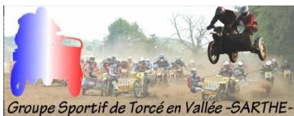
Groupe Sportif de Torcé en Vallée -SARTHE-

Le Lion d'Or « Chez Evelynne » Salle de réunion 7 Place de l'église - 72110 Torcé-en-Vallée Tel : 02 43 29 46 23