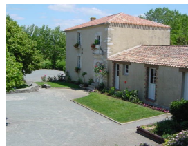
Maison de la Cour

espaces verts, l'étendue des marais et la traversée des lagunes, jusqu'au retour à la Maison de la Cour avec sa porte renaissance et les vestiges de la nécropole mérovingienne que vous pouvez voir dans la crypte.