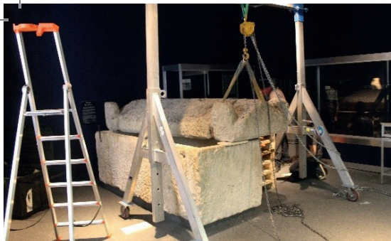
Déménagement du sarcophage