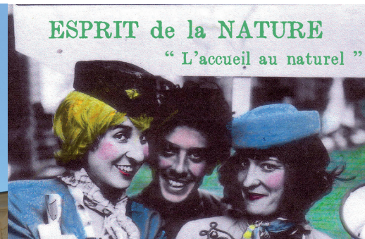
La troupe de la Compagnie Midi à l'Ouest

Les élèves du Lycée Notre-Dame vous invitent à une présentation du portail sculpté et vous convient ensuite à une visite du château par les propriétaires actuels.