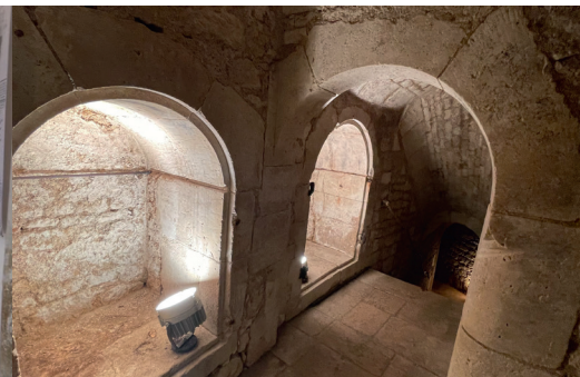
Ancienne salle du Conseil municipal