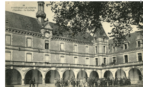
L'ancien collège Viète et ses élèves

Ce projet intègre également une dimension d'éco-rénovation énergétique, visant à améliorer l'efficacité énergétique du bâtiment et à réduire son empreinte carbone, contribuant ainsi positivement à la protection de l'environnement.