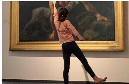
Initiation au yoga devant le tableau d'Hercule