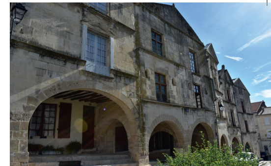
Les arcades de la Place Belliard

Partez à la rencontre de Tanagrau, le géant de l'Hôtel de la Pérate, de la Dormeuse de Chaix, des Ondines qui peuplent la rivière Vendée, d'un petit mulot qui idolâtre le Général Belliard ou encore de deux coqs qui s'invectivent à longueur de siècles au-dessus de nos têtes... !