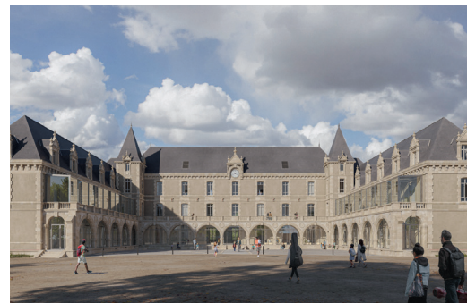
Futur Pôle Intercommunal Culture Jeunesse © Urbanmakers

Ludovic HOCBON Maire de Fontenay-le-Comte Président du Pays Fontenay-Vendée Conseiller régional des Pays de la Loire.