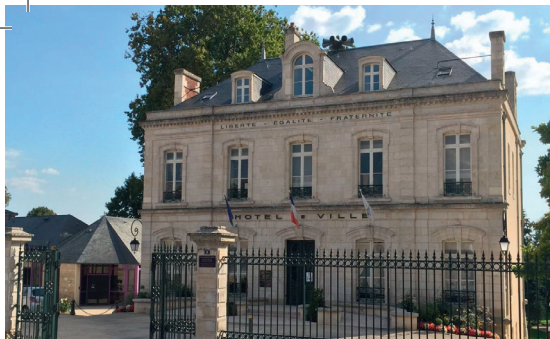
Vue extérieure de l'église Saint-Jean-Baptiste