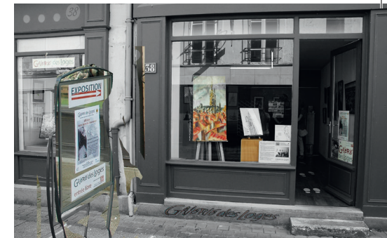
La rivière Vendée

Pour plus de confort, nous vous conseillons de privilégier une visite le vendredi et le samedi.