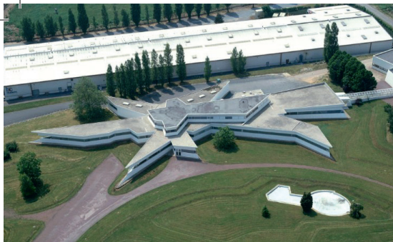
Vue aérienne de l'Usine Étoile