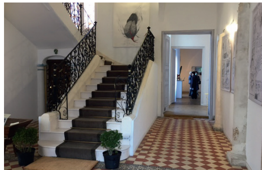
Vestibule et escalier en fer forgé de la propriété