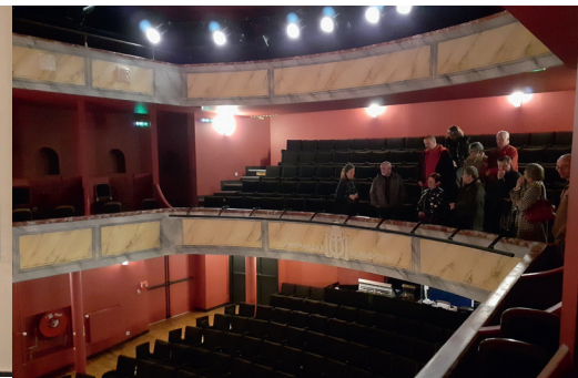
L'intérieur du théâtre