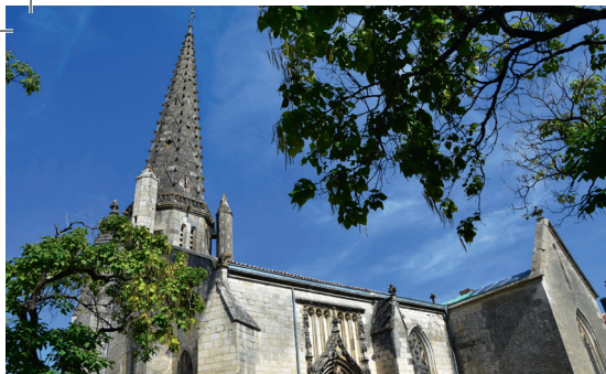
Vue extérieure de l'église Saint-Jean-Baptiste