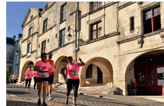
Une course à pied dans les rues de Fontenay