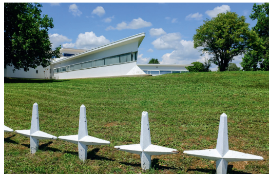
Détail de l'architecture du bâtiment