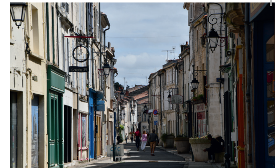
La rue des Loges et ses enseignes