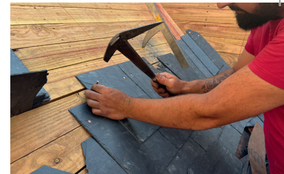
Les travaux de toiture