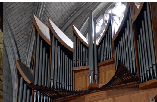
L'orgue de l'église Notre-Dame de l'Assomption