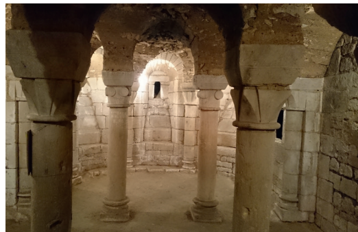
Crypte de l'église Notre-Dame de l'Assomption