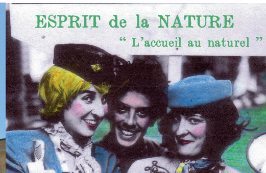
La troupe de la Compagnie Midi à l'Ouest