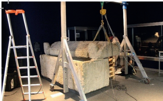
Déménagement du sarcophage