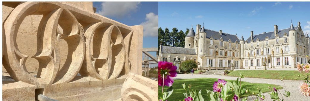
Détail de la rembarde du clocher

L'église actuelle garde les lignes et proportions données à cette époque : l'intérieur à trois nefs, la porte sud à ogives flamboyantes, le clocher copié sur celui de Notre-Dame. Le 19 e siècle est une période d'embellissement avec une décoration intérieure soignée dont l'orgue, le maître-autel selon le plan d'Octave de Rochebrune, une Pietà.