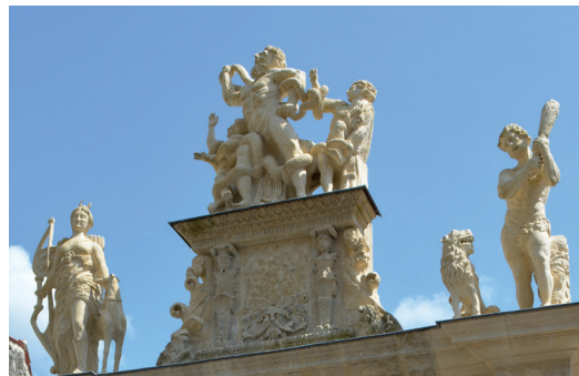
Le portail avec ses sculptures mythologiques