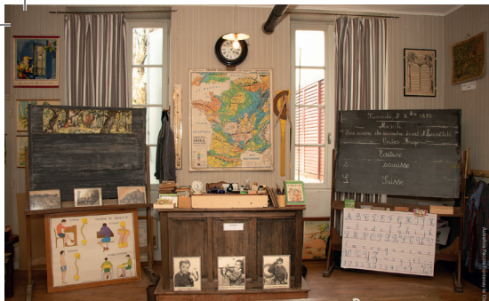
Musée Autrefois l'École