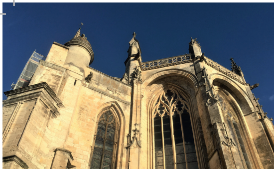
Notre-Dame de l'Assomption