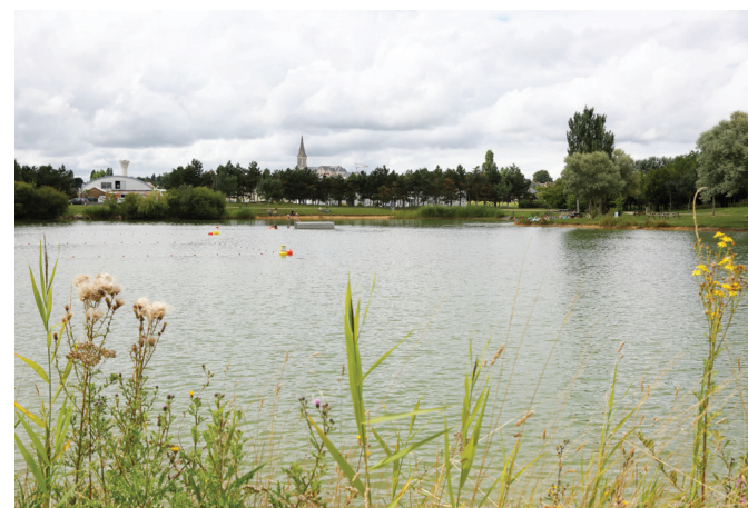
Étang du Petit Anjou (Val-d'Erdre-Auxence, Le Louroux-Béconnais)