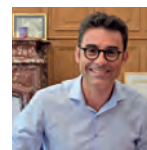
Ludovic HOCBON, Maire de Fontenay-le-Comte