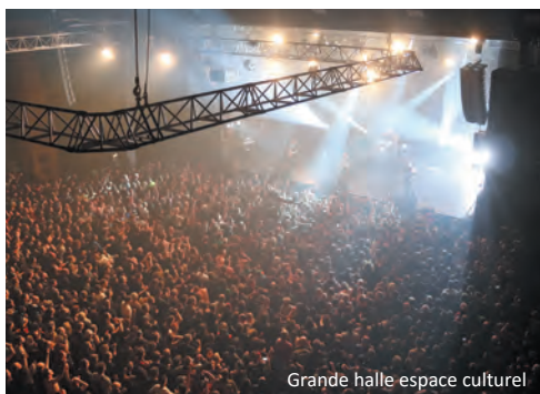
Grande halle espace culturel

Escale incontournable du territoire, René-Cassin-La Gare est une invitation au voyage, de la simple escapade à la grandiose épopée.