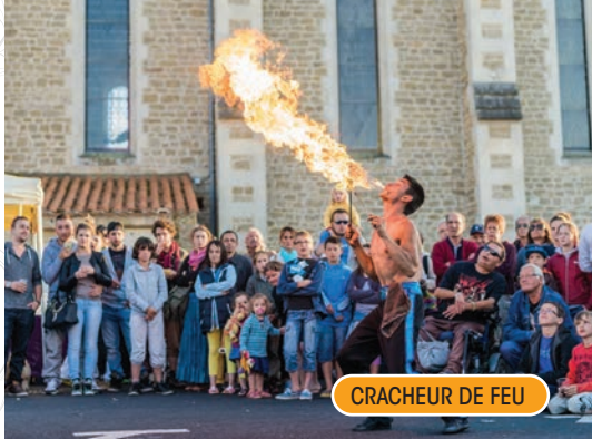
CRACHEUR DE FEU