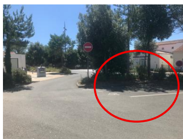
Place PMR derrière l'office

Nous avons une place de parking réservée PMR (à 40 m) derrière l'Office de tourisme et une autre (à 10 m) devant l'Office de tourisme accessible en traversant le passage piétons reliant le parking au bâtiment.