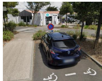
Place PMR devant l'office

L'accès au bureau d'information touristique se fait pas l'entrée principale, la porte vitrée est munie de bandes de vigilance. Chacune des portes mesure 0,73 m soit 1,46 m d'ouverture.