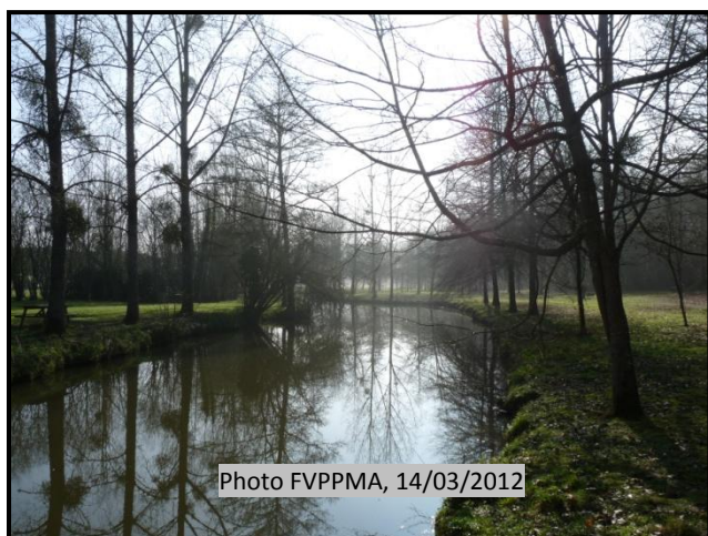
Nom de l'association de pêche : La Friture