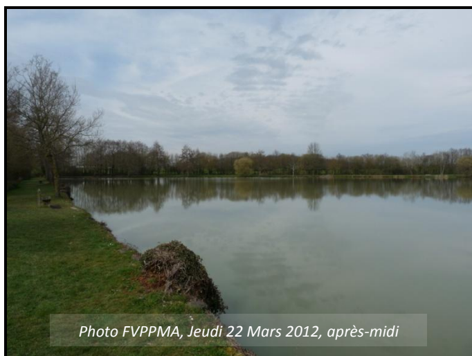
Jeudi 22 Mars 2012, après-midi