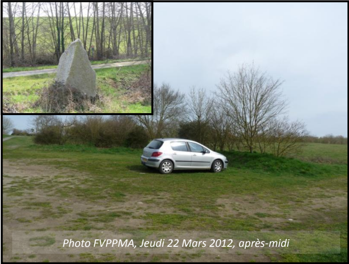
Jeudi 22 Mars 2012, après-midi

Légendes ● Parcours de pêche P Parking(s)