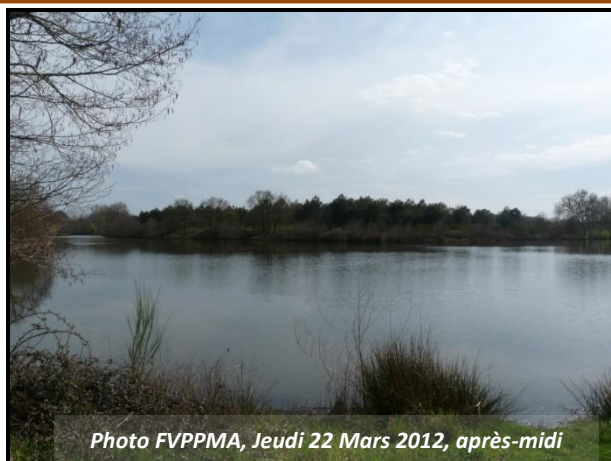
Jeudi 22 Mars 2012, après-midi