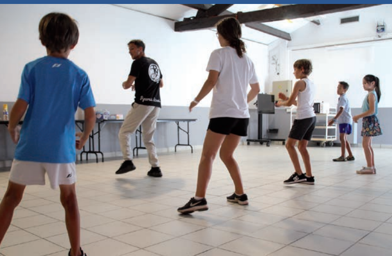
Illustration médiation culturelle 2022 : atelier Hip-Hop à la salle de la Conserverie.

Le service culturel de Saint Gilles Croix de Vie développe de nombreuses actions pour tous les publics !