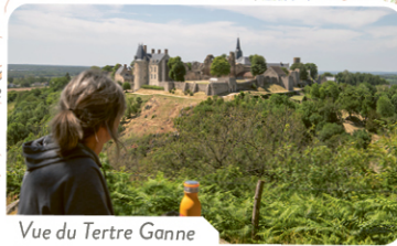
Vue du Tertre Ganne