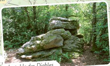
La table des Diables