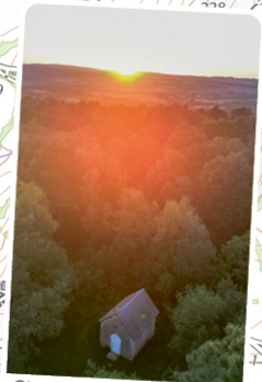
Chapelle de La Croix-Lamare