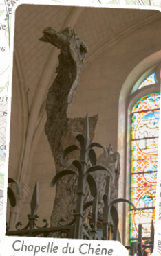
Chapelle du Chêne