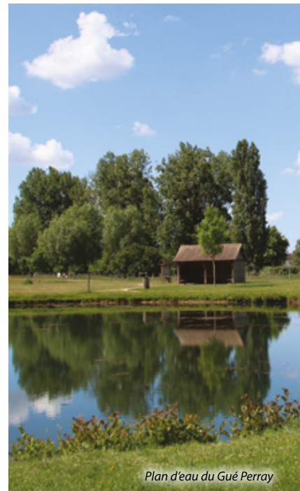
Plan d'eau du Gué Perray

Des jonctions vers d'autres circuits sont possibles à partir de cette randonnée. Pour en savoir plus, consultez le plan général.