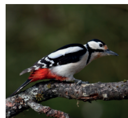
Pic Épeiche (toute l'année)