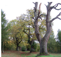
Nouzillards (toute l'année)