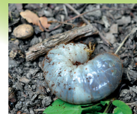
Larve de Pique-prune

Le Pique-prune ou Osmoderma eremita , est une espèce rare, au statut d'espèce protégée. Il est devenu un emblème de la conservation de son habitat : les arbres à cavités, vivants ou déperissants. Le Pique-prune est à l'origine une espèce forestière, son cycle biologique est