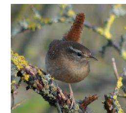
Troglodyte mignon (toute l'année)