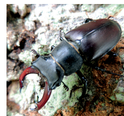
Lucane Cerf-Volant (mâle) (mai à août)

Mais aussi : le Grand Capricorne, le Pique-prune