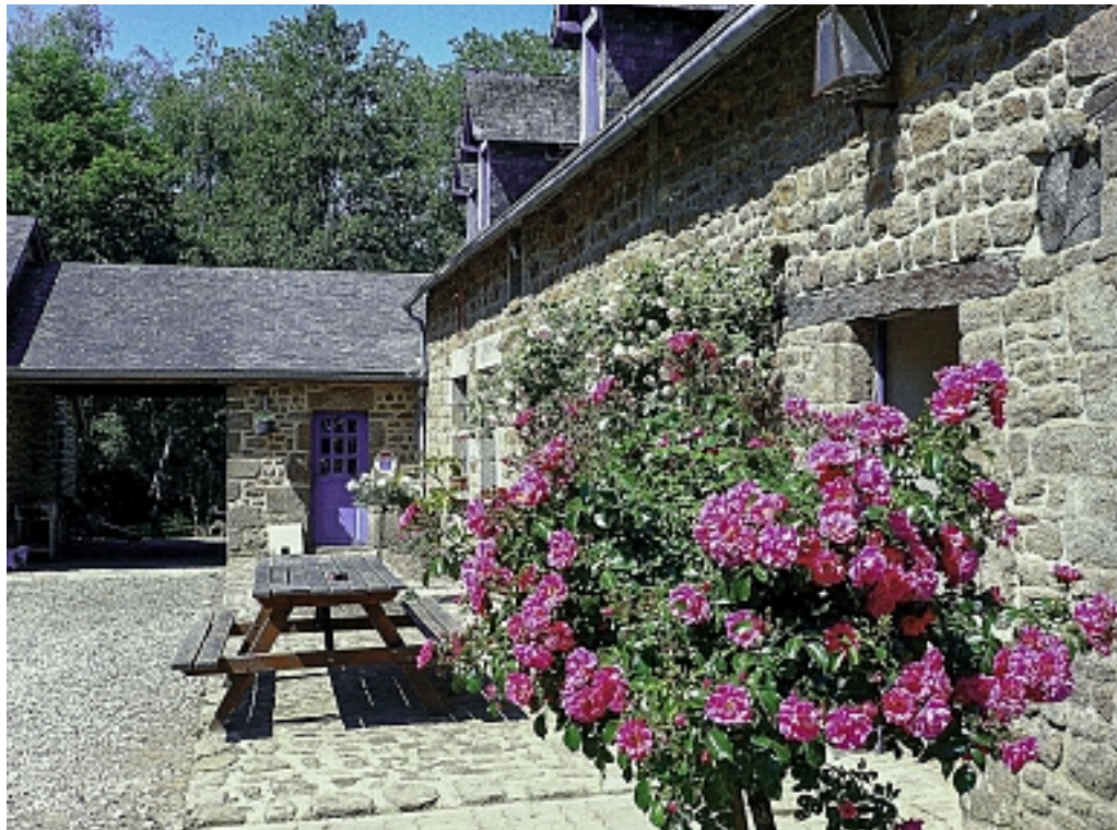
Ferme de la Rouërie Saint-Berthevin la Tannière

Non loin de là, profitez-en pour visiter l'élevage de chèvres de la Rouërie et acheter leurs excellents fromages : ferme de La Rouërie (accès fléché) Tél. 02 43 05 36 86