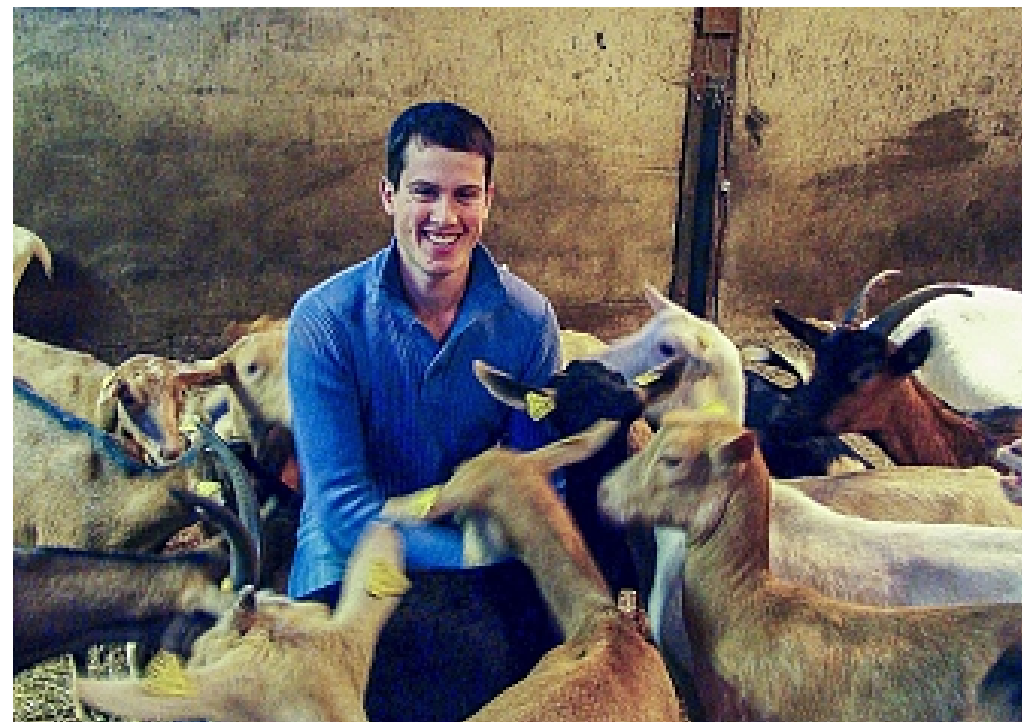
Ferme de la Roterie Saint-Berthevin-la-Tannière