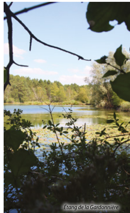
Étang de la Gardonnière

Le Gué de la Gardonnière, qui a donné son nom à cette randonnée, constitue le trop-plein de l'étang de la Gardonnière. Quelques aconits napels (plantes de montagne très rares en Sarthe) et autres plantes carnivores poussent dans le secteur.