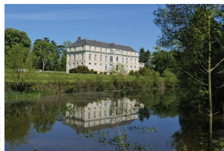
Château de l'Isle Briand (Le Lion d'Angers)

5 À la sortie de la zone d'agglomération, emprunter le sentier qui descend vers la rivière « la Mayenne ». Cheminer le long de celle-ci, direction sud-est, puis passer devant > la Grotte et > le Moulin, pour rejoindre le point de départ.