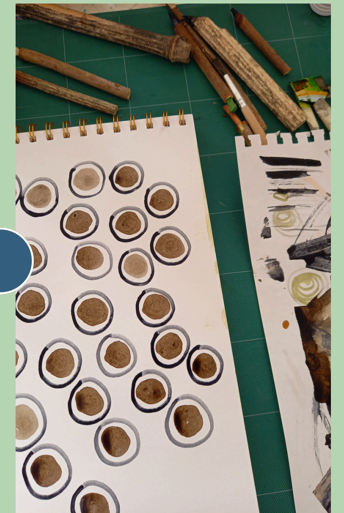
› avec les ressources locales

Durée : 2h - Jauge : 15 personnes max - Tarif : à la demande