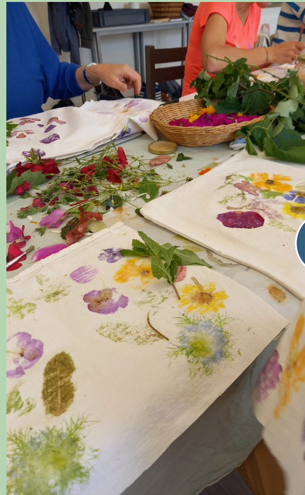
› Impression végétale

Mélange de tissus et de couleurs avec l’art ancestral des feuilles frappées ou tataki zomé. Chaque végétal et ses pigments, nous racontent ses histoires colorées pour un moment créatif. Essayer puis créer, chacun à sa manière.